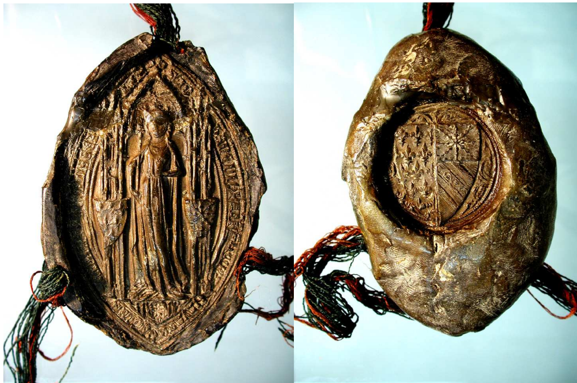
Sceau de Jeanne de Navarre apposé sur un acte de 1294

Jeanne de Navarre est née le 14 janvier 1273 à Bar-sur-Seine. Elle n'a que 18 mois lorsque meurt son père, le comte de Champagne Henri III, roi de Navarre. Elle est sa seule héritière. Jeanne est placée à la cour de France sous la protection du roi Philippe III. A douze ans, elle épouse le fils du roi de France, Philippe le Bel qui n'en a que 16. L'année suivante, il succède à son père et Jeanne devient sa reine. Jeanne et Philippe ont sept enfants. Trois de leurs fils deviendront successivement rois de France, et parmi leurs filles, l'une sera reine de Castille et l'autre d'Angleterre.